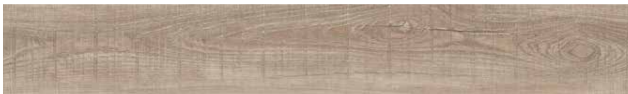
Sawn Chalked Oak Art.-Nr. 80002792