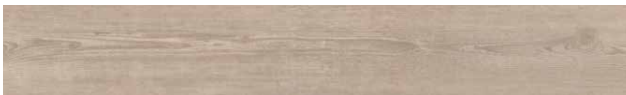
Rye Pine Art.-Nr. 80002789