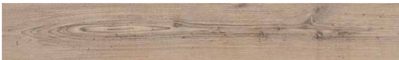
Brushed Rustic Pine Art.-Nr. 80002793