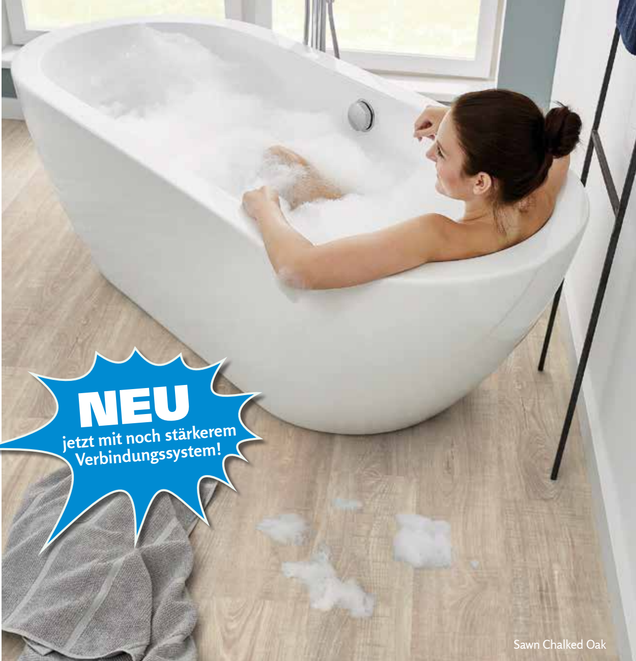
Sawn Chalked Oak