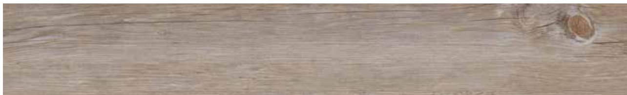
Kenai Oak Art.-Nr. 80002788