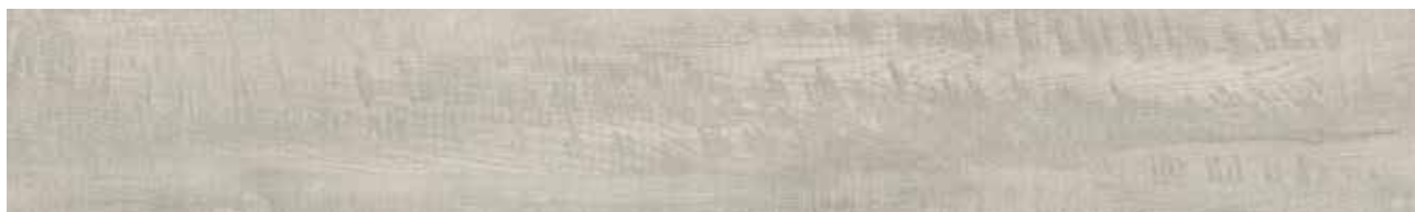
Silver Snow Oak Art.-Nr. 80002791