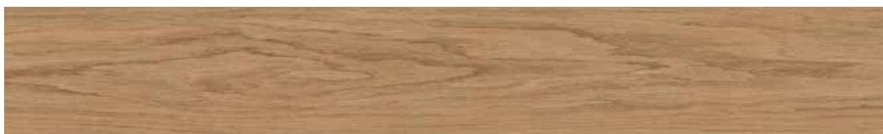
Primal Oak Art.-Nr. 80002790