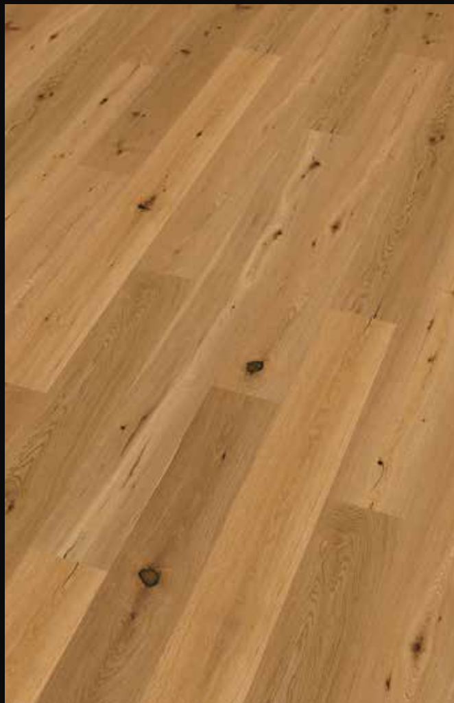
„Riga / Krakow“